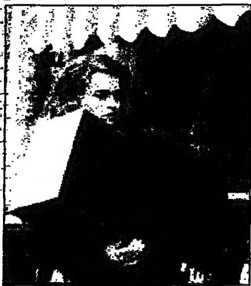
في مشهد من آخر أفلامها ومفتح مارفريت